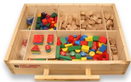
Счет. Цифры. Геометрия

Цветные плоские полукруги радиус 12мм. - не менее 56 шт. Цветные плоские ромбы размер 24*24мм. - не менее 56 шт. Круги Тип №2 диаметр 10 мм. - не менее 400 шт.