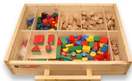
Счет. Цифры. Геометрия

Цветные плоские полукруги радиус 12мм. - не менее 56 шт. Цветные плоские ромбы размер 24*24мм. - не менее 56 шт. Круги Тип №2 диаметр 10 мм. - не менее 400 шт.